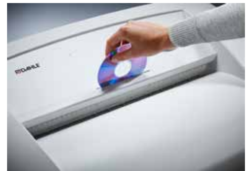
Dahle Aktenvernichter Security 516air