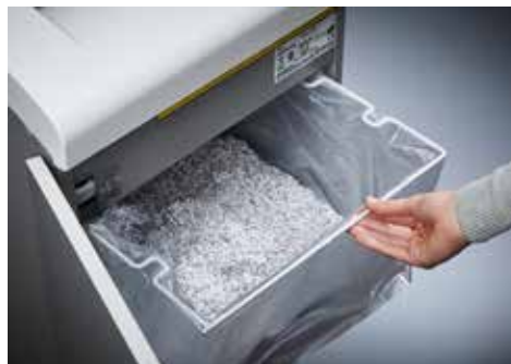
Dahle Aktenvernichter Security 516air