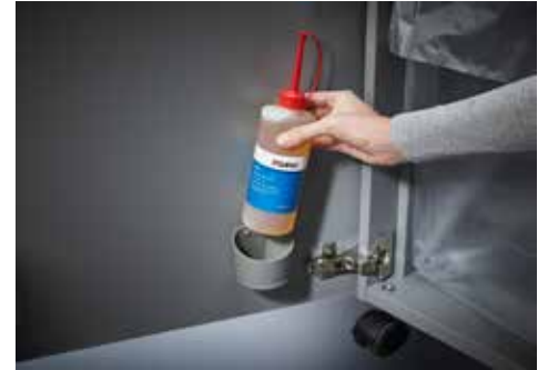
Dahle Aktenvernichter Security 516air