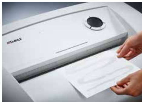
Dahle Aktenvernichter Security 516air