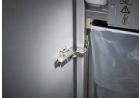
Dahle Aktenvernichter Security 516air