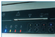
Bedienung über Touch-Board-Tastatur, LED-Leuchtanzeigen für alle Funktionen