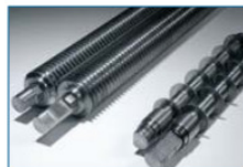
Getrennte Schneidwellenpaare für Papier und CD's/ Kreditkarten