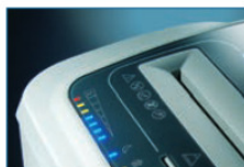
LED-Lastanzeige beim Schreddern