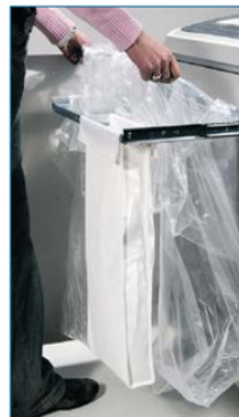
Getrennte Auffangbehälter für Papier und CD's/ Kreditkarten