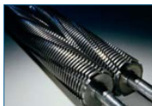
Papierschnidwellen: 5 Jahre Gewährleistung (außer HS5/ HS 6 Modelle)