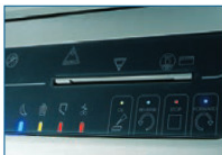
Bedienung über Touch-Board-Tastatur, LED-Leuchtanzeigen für alle Funktionen