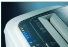
LED-Lastanzeige beim Schreddern