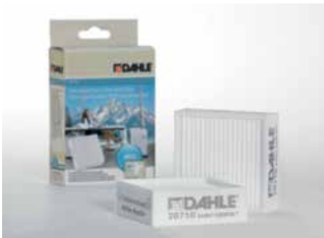
Feinstaubfilter Dahle 20710