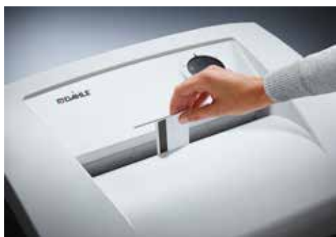
Dahle Aktenvernichter Office 410air