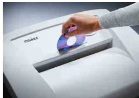
Dahle Aktenvernichter Office 410air