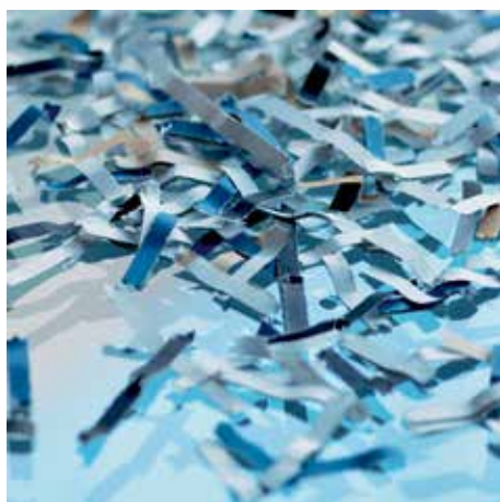
Sicherheitsstufe P-4: Empfohlen für Datenträger mit besonders sensiblen, vertraulichen und personenbezogenen Daten