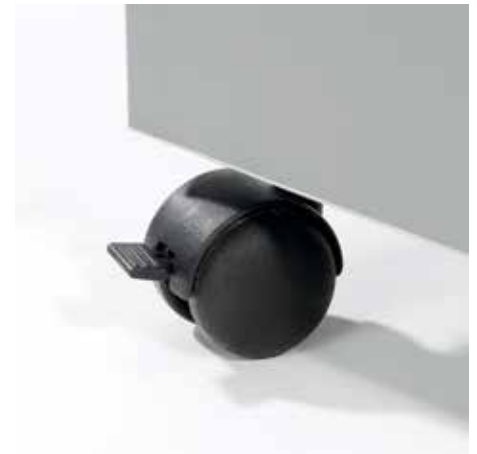
Praktische Lenkrollen für den flexiblen Einsatz