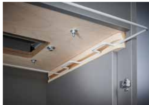
Dahle Aktenvernichter Office 410air