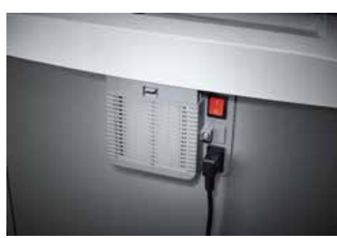
Dahle Aktenvernichter Office 410air