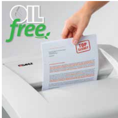
Komfortabel vernichten, völlig ohne zeitraubendes Ölen der Schneidwalzen