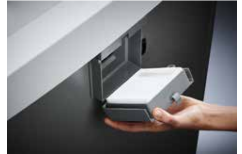
Dahle Aktenvernichter Office 410air