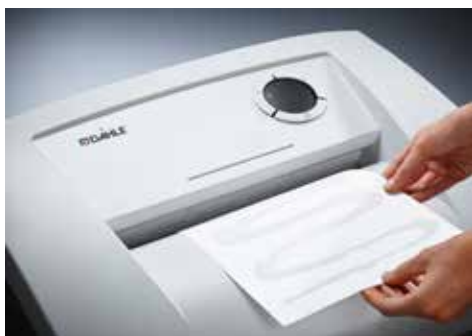
Dahle Aktenvernichter Office 410air