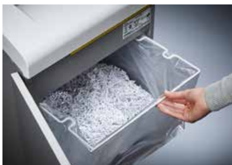
Dahle Aktenvernichter Office 410air