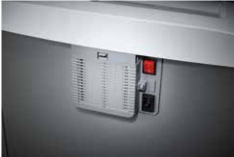
Dahle Aktenvernichter Office 410air