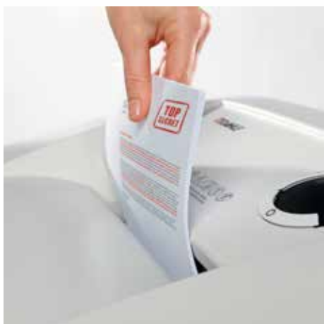
Bis zu 30 % höhere Blattleistung durch die innovative MHP Technology®