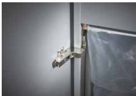
Dahle Aktenvernichter Office 410air