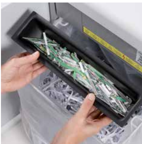
Separate, integrierte Auffangbehälter unterstützen bei der umweltfreundlichen Abfalltrennung von Papier und CDs, DVDs, Scheck- und Kreditkarten