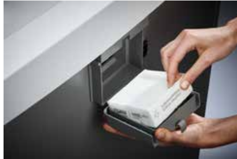
Dahle Aktenvernichter Office 410air