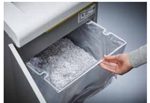
Dahle Aktenvernichter Security 514