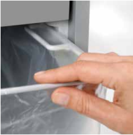
Ausziehbare, abgerundete Schiene ermöglicht das komfortable Wechseln des Auffangbeutels