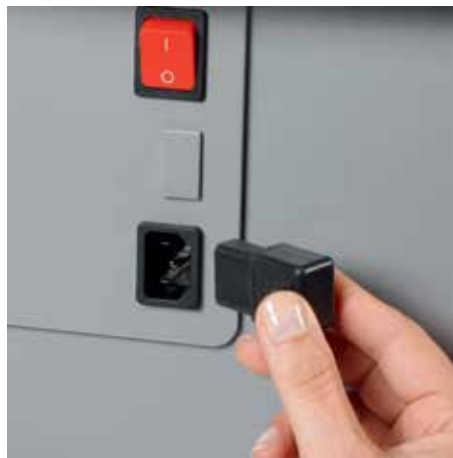
Abziehbarer Kaltgerätestecker vereinfacht das schnelle Bewegen des Aktenvernichters von A nach B