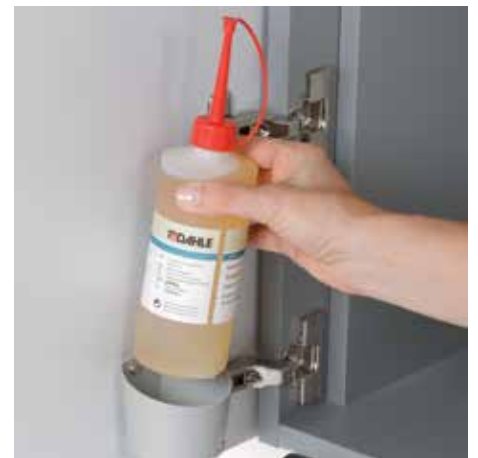
Umweltfreundliches Öl ist jederzeit griffbereit - inklusive bei allen Cross-Cut-Modellen