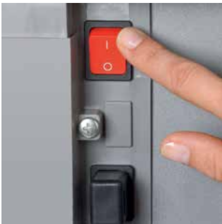
Separater Hauptschalter befindet sich auf der Rückseite des Aktenvernichters und trennt diesen komplett vom Netz