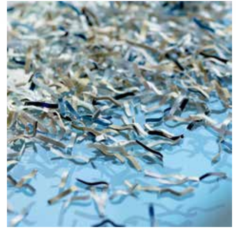
Sicherheitsstufe P-5: Empfohlen für Datenträger mit geheim zu haltenden Daten