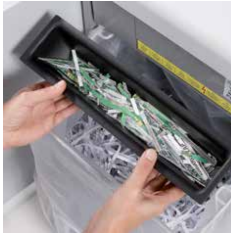
Separate, integrierte Auffangbehälter unterstützen bei der umweltfreundlichen Abfalltrennung von Papier und CDs, DVDs, Scheck- und Kreditkarten