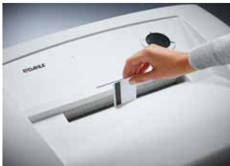
Dahle Aktenvernichter Waste 114