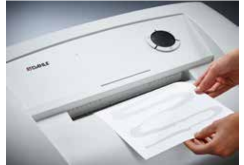
Dahle Aktenvernichter Waste 114