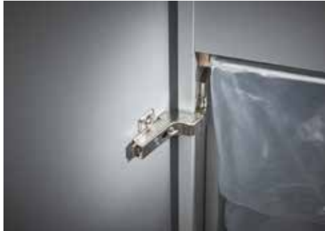
Dahle Aktenvernichter Waste 114