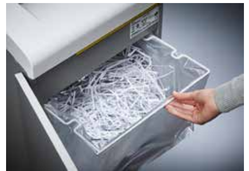
Dahle Aktenvernichter Waste 114