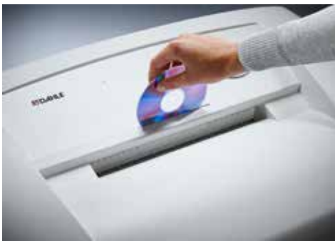
Dahle Aktenvernichter Waste 114