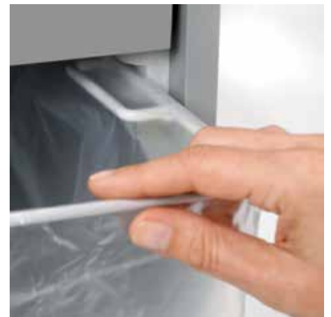
Ausziehbare, abgerundete Schiene ermöglicht das komfortable Wechseln des Auffangbeutels