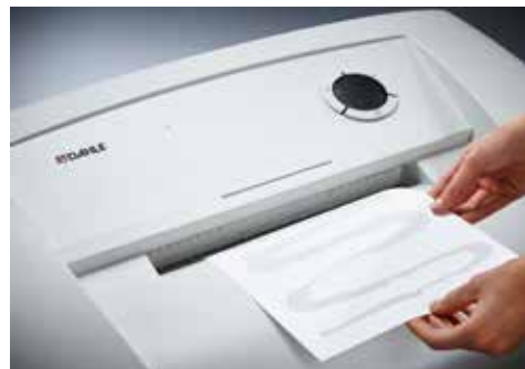
Dahle Aktenvernichter Waste 214