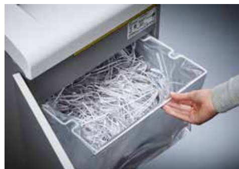
Dahle Aktenvernichter Waste 214